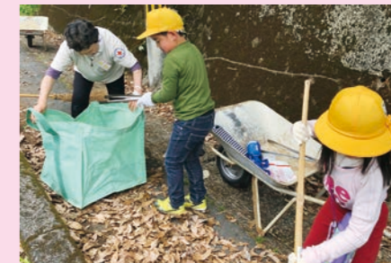
青少年赤十字活動