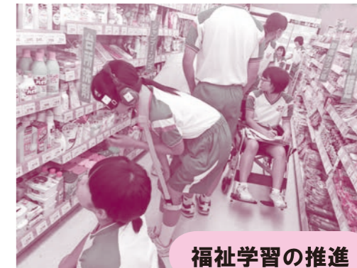
地域福祉活動計画推進会